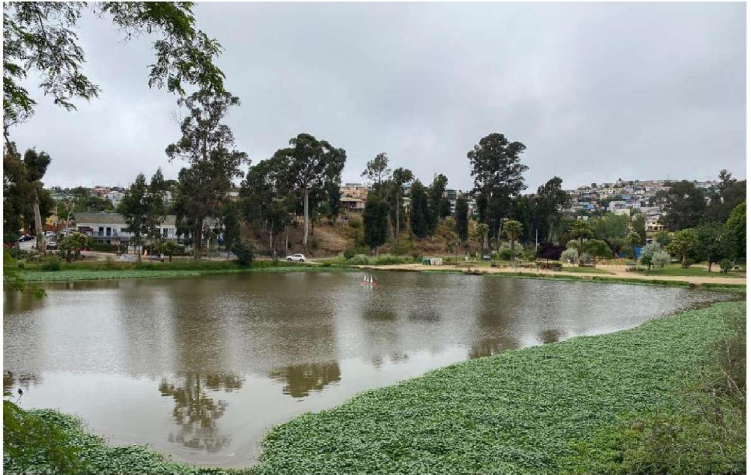
► Según vecinos de Viña del Mar, el proyecto habitacional en la ribera del Tranque de Forestal, en la foto, disminuiría las áreas verdes y las zonas de esparcimiento.

ta de la Unión Comunal (Unco) de Forestal, dijo que “cuando supimos de esta iniciativa municipal nosotros inmediatamente dijimos no, no podemos aceptar que nuestro tranque lo maten, así que estamos trabajando con todas las organizaciones, para que esto no suceda. Siempre vamos a defender el medio ambiente”.