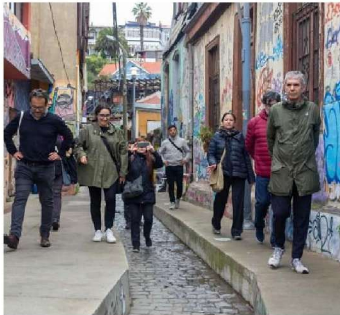
► La lista busca proteger bienes que figuran como Patrimonio Mundial.

“¿Qué recomienda, desde la institución u organización que representa, o desde el barrio