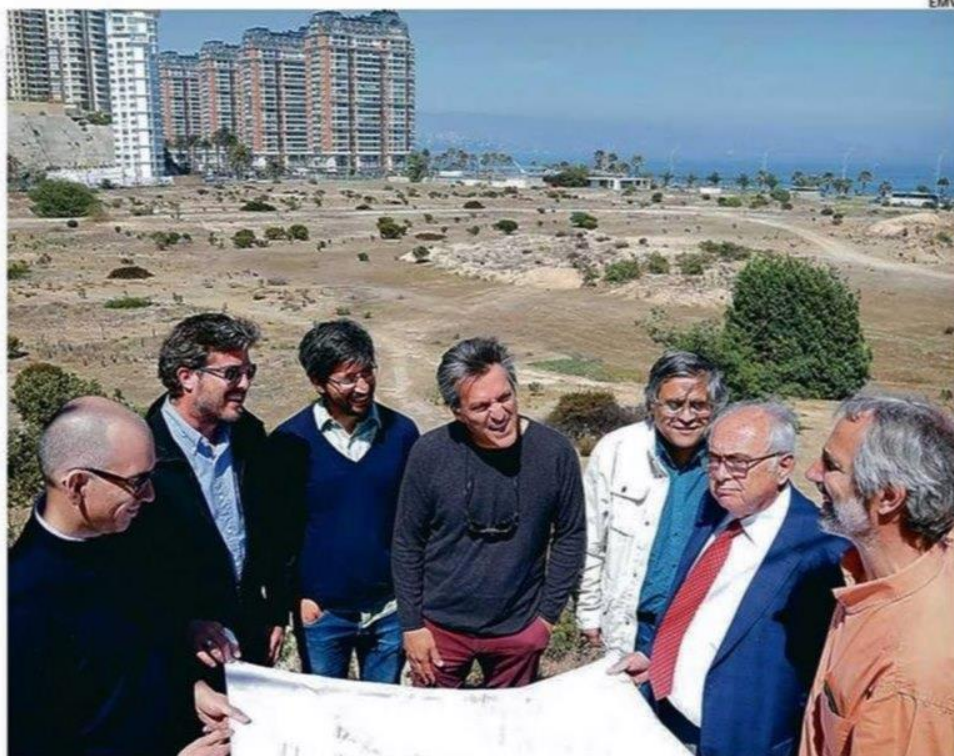
CINCO ACADÉMICOS DE UNIVERSIDADES REGIONALES PARTICIPARON EN EL PROYECTO DE BIORREMEDIACIÓN.